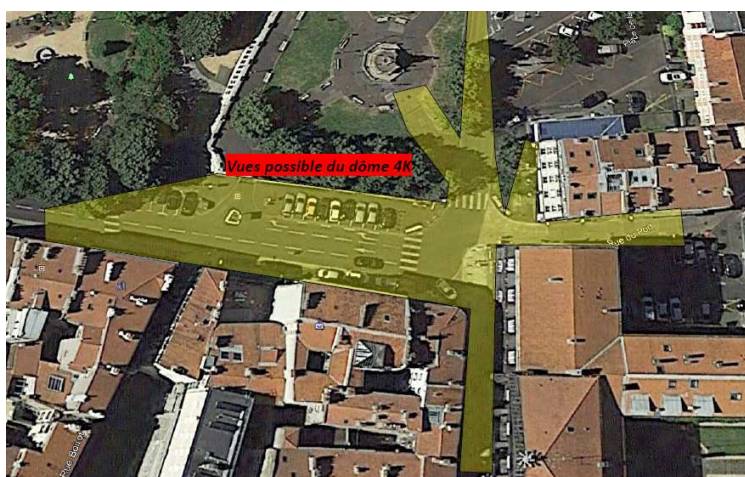
↪ Rue Saint Hérem