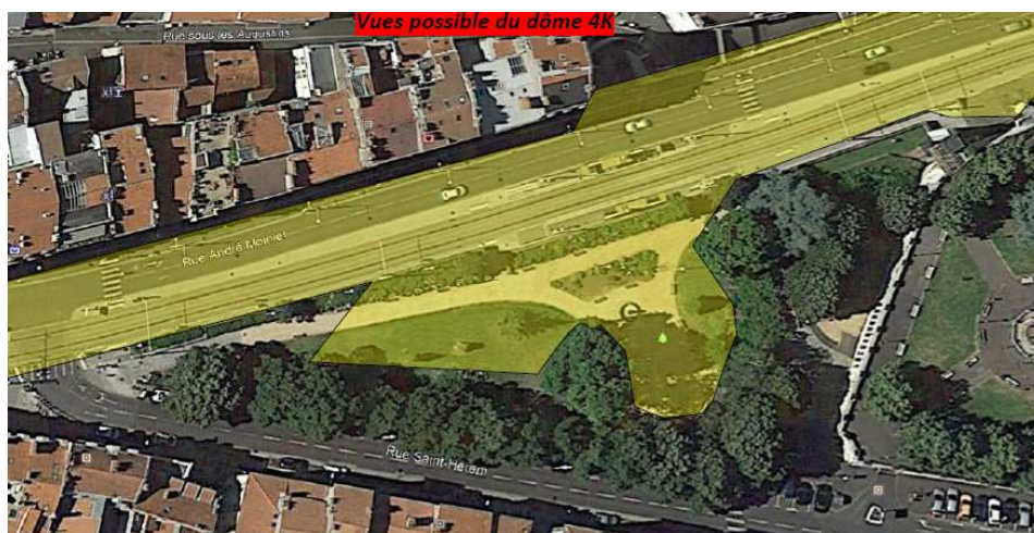
↪ Square Blaise Pascal